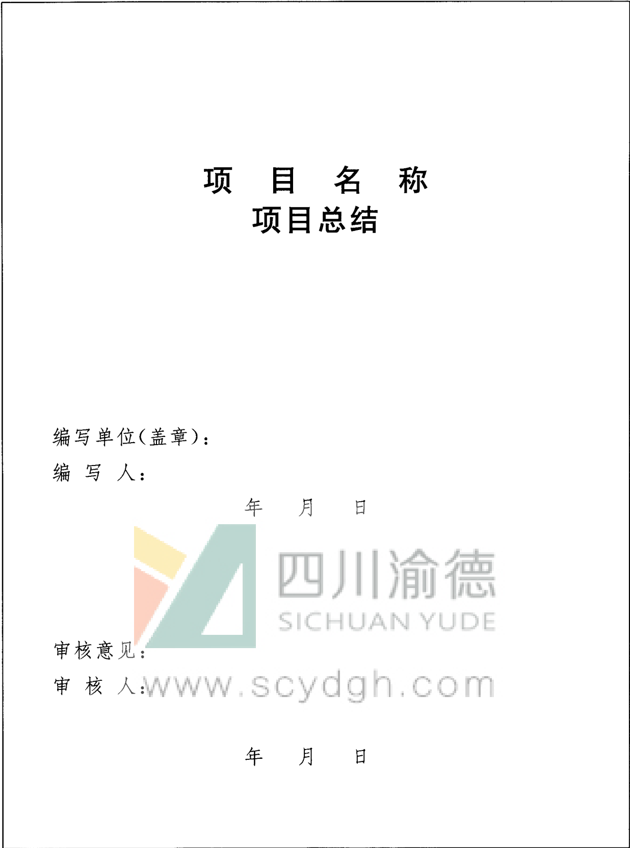
图 A.3 项目总结副封面格式