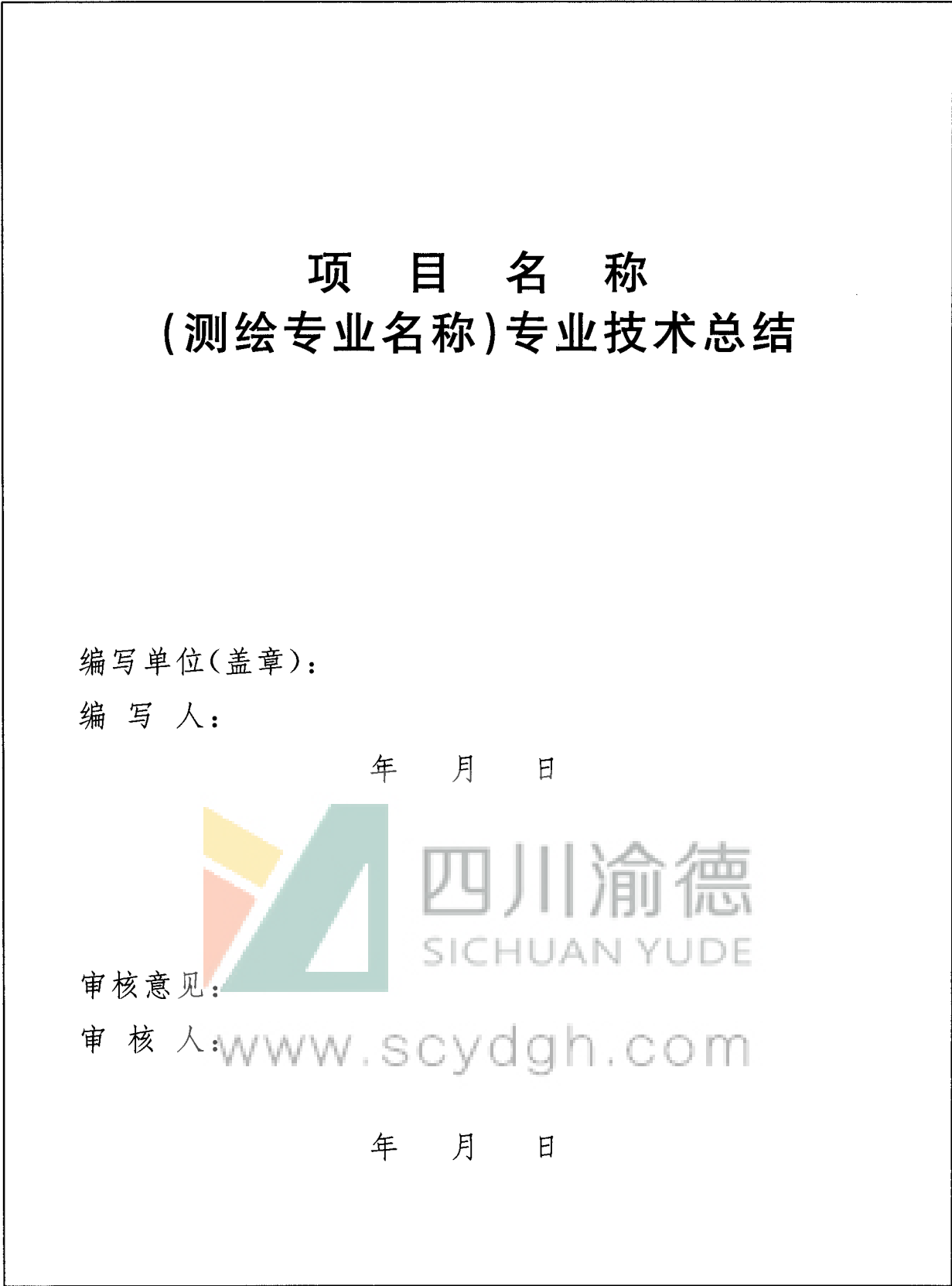
图 A. 4 专业技术总结副封面格式