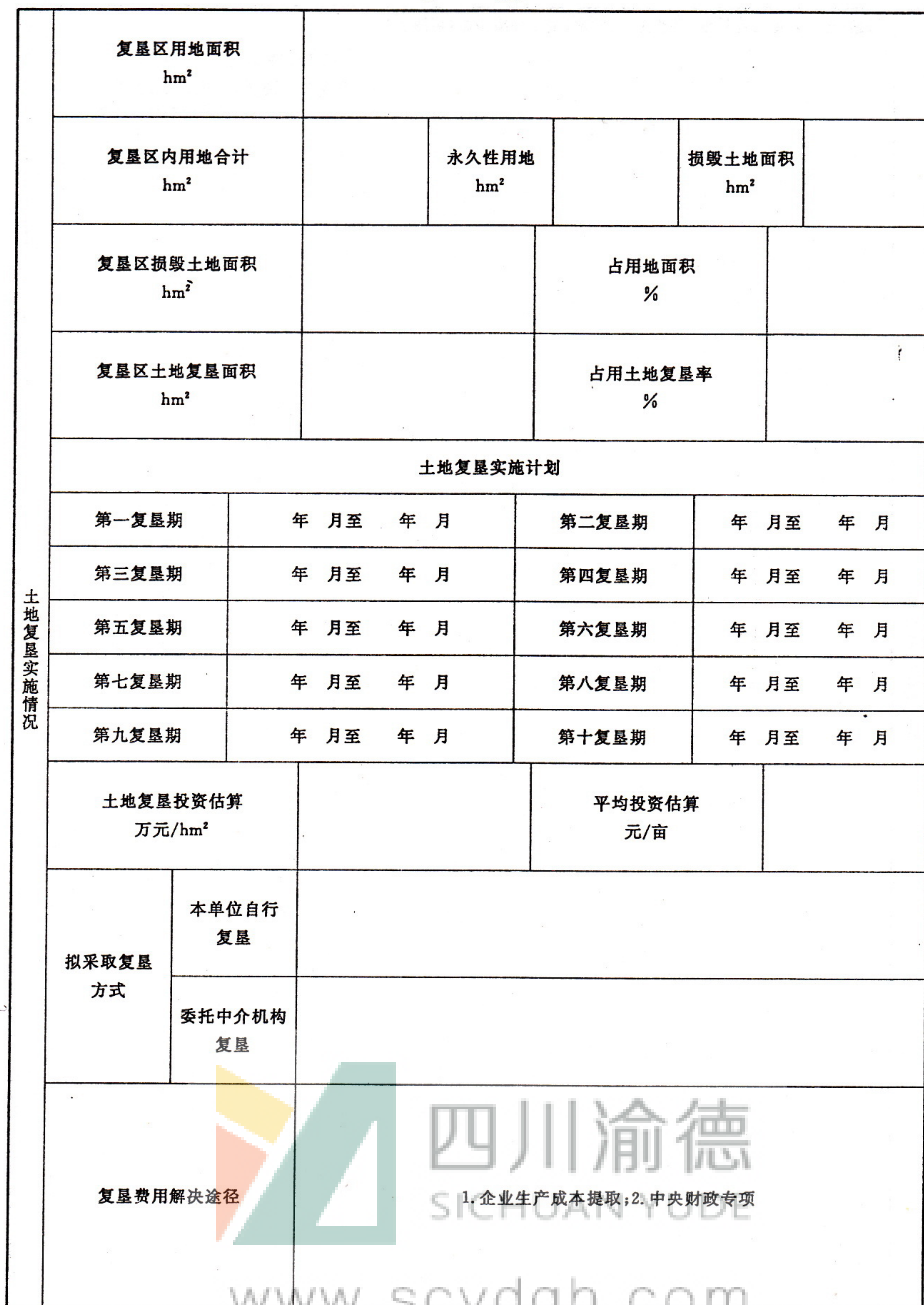
表 A.1 (续)